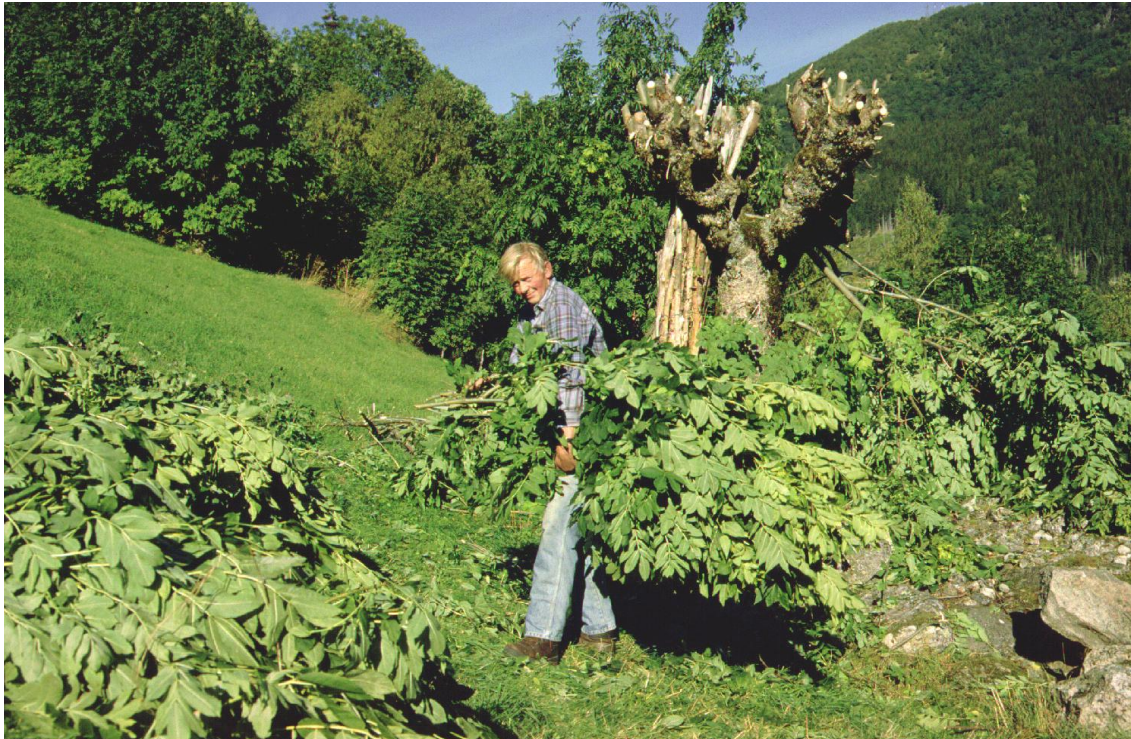
Figur 2. Det må utarbeidast framdriftsplanar for dokumentasjon av kulturlandskapskvalitetar. Ut frå eit mål for dokumentasjon bør det setjast opp ei prioriteringsliste over objekt/handlingar med ein tidshorisont for gjennomføring.

dokumentasjon, bør det setjast opp ei prioriteringsliste over objekt/handlingar og ein tidshorisont. Eit dokumentasjonsprosjekt må setjast i gang snøggast råd.