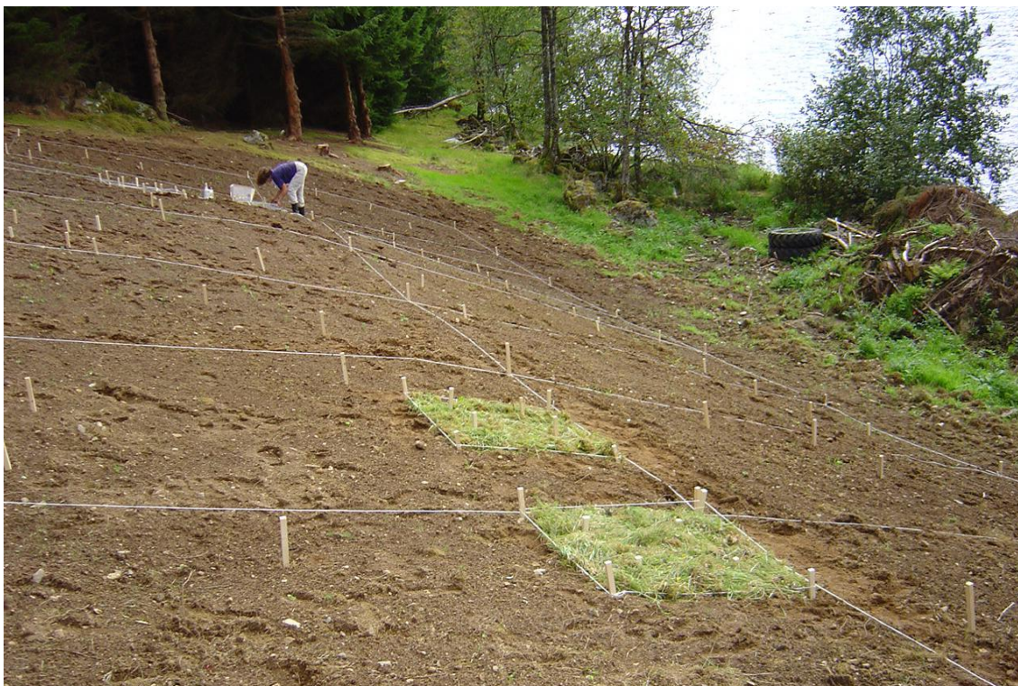
Figur 8. Kompetansesenteret må fokusere på forskning på kulturlandskapet som her frå etableringsforsøk av urterike enger på Sunnfjord Folkemuseum. Viktig er også formidling av forskingsresultat.