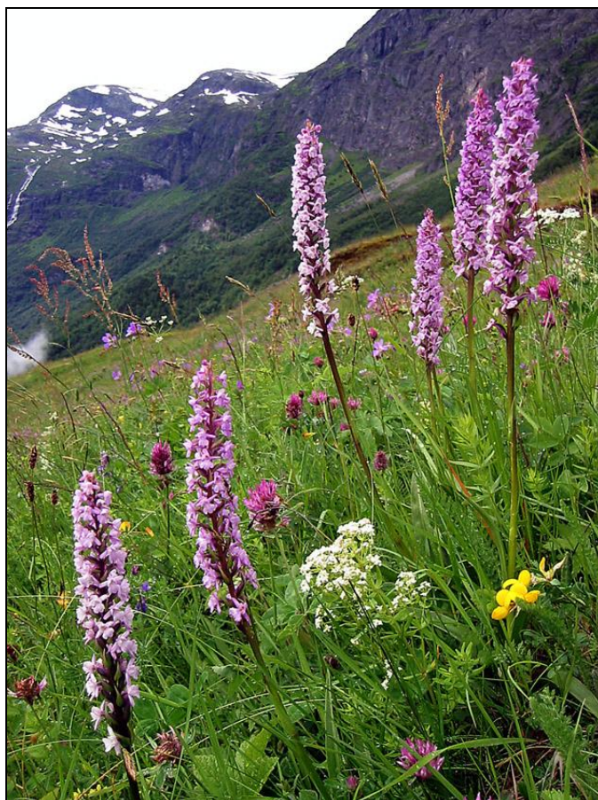
Figur 1. Stort artsmangfold er knytt til kulturlandskapet og dei halv-naturlege vegetasjonstypene. Kva artar som inngår er avhengig av lokalisering, nærings- og fukttilhøve, og ikkje minst av driftsforma. Det er viktig at areala vert brukte tradisjonelt, dersom verdiane skal ivaretakast.