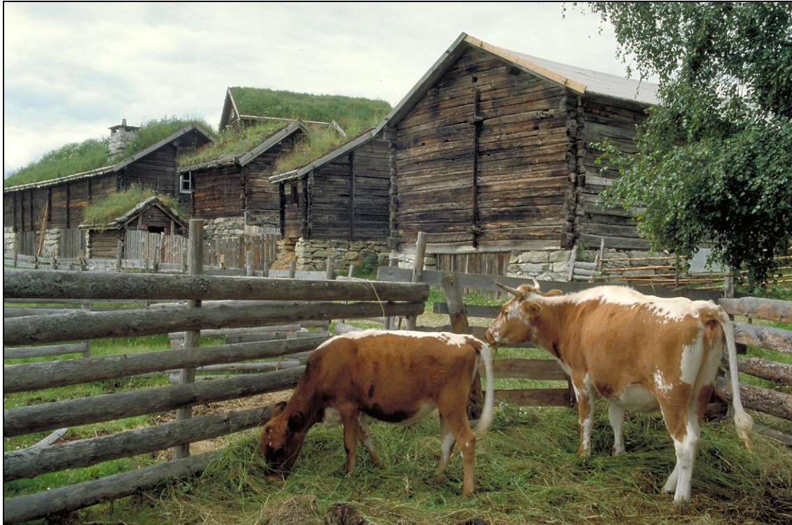
Figur 4. Attskaping av kulturlandskap og artsmangfald på konkrete friluftsmuseum er ynskjeleg. Viktig er også å gje informasjon om arbeidsteknikkar og rutinar gjennom aktiv landbruksdrift.