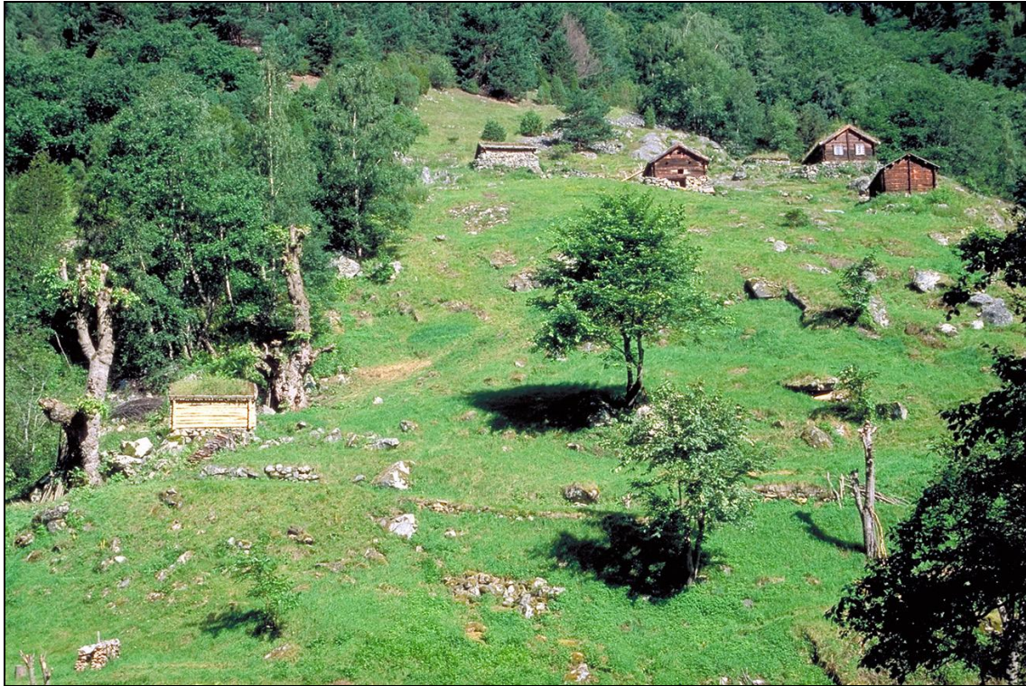
Figur 5. Musea kan få ansvar for å forvalte sentrale kulturlandskap og kulturmiljø i eit regionalt- og nasjonalt museumsnettverk. Kulturlandskapa som skal inngå i museumsnettverk bør veljast ut etter ein prosess der både fagmiljø, forvaltning og grunneigarar eller grunneigarorganisasjonar deltek.

Desse gamle eigedomane utgjer ei verdifull samling av kulturlandskap med kvar si historie. Musea som forvaltar desse eigedomane i dag bør stelle desse eigedomane slik at kulturlandskapet med sine biologiske kulturminne vert teke vare på i lag med bygningar og andre kulturspor. Dette er ei viktig oppgåve for musea. Kanskje det er tid for at musea også får eit utvida ansvar for å stelle eit utval av dei mest verdifulle kulturlandskapa, ikkje berre på musea sine eigne område, men også for eit utval av verdifulle kulturlandskap i regionen? (figur 5).