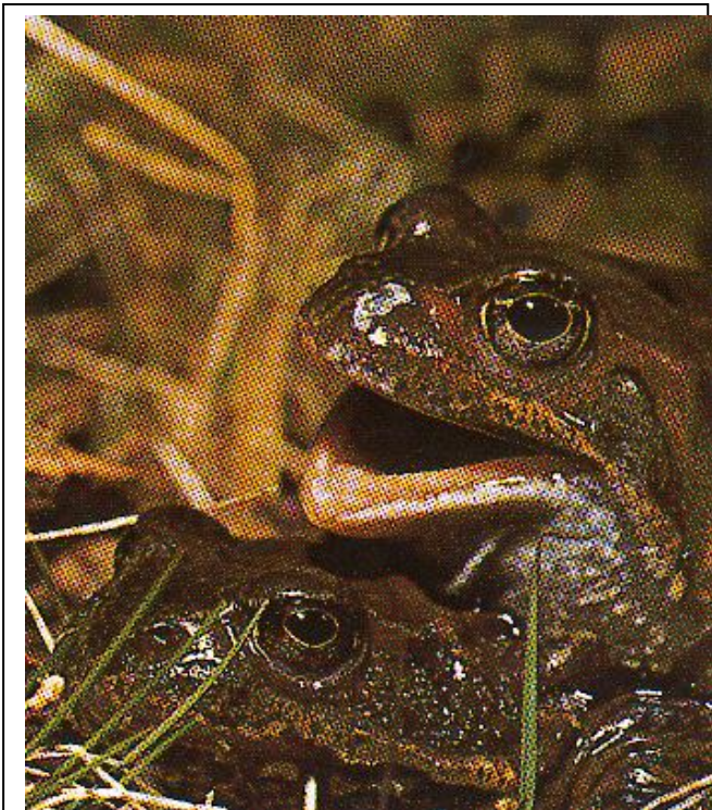
Over: Vanleg norsk frosk i ei hyrdestund.