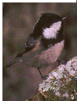
5 - SVARTMEIS