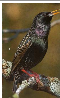
8 – STARE