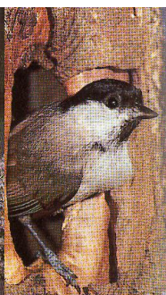
6 - LAUVMEIS