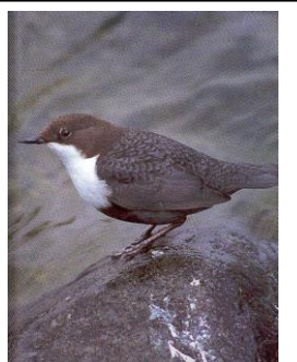
7 – FOSSEKALL