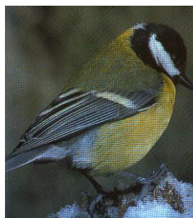
1 – KJØTMEIS