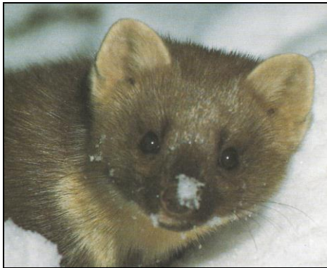
Kvit brystflekk og buskete hale er karakteristisk for den årvakne måren.

Mår har vore eit ettertrakta vilt på grunn av den fine pelsen, og heilt sidan 1300-talet har mårskinn vore eksportvare frå Noreg.