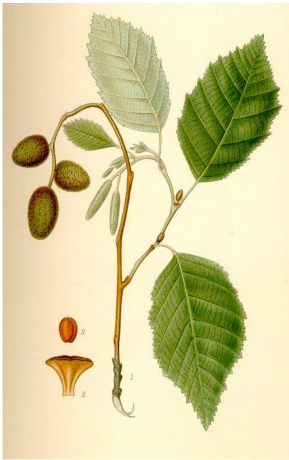
1: Kvist med blad og fullvaksne konglar og blomsterknoppar for neste år. 2: Kongleblad 3: Nøtt (frø)